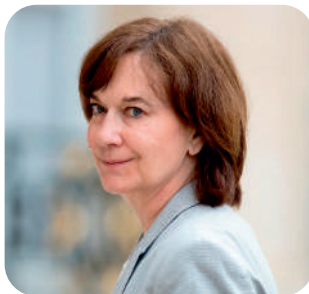
Laurence ROSSIGNOL Sénatrice socialiste Ancienne ministre

Centre Charlemagne 7, rue Félix-Braquet en présence de :